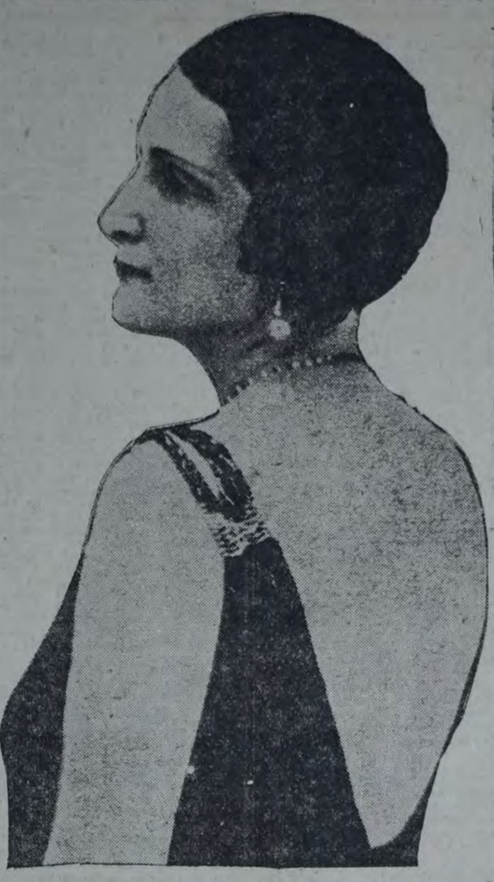
LA PRIMERA ACTRIZ IRENE LOPEZ HEREDIA, BIEN CONOCIDA POR NUESTRO PUBLICO, NOS VISITARA NUEVAMENTE LA PROXIMA TEMPORADA Y NOS DARÁ A CONOCER LA ZARZUELA OBRA DE JACINTO BENAVENTE, "PARA EL CIELO Y LOS ALTARES", CUYA REPRESENTACION PROHIBIÓ LA CENSURA.