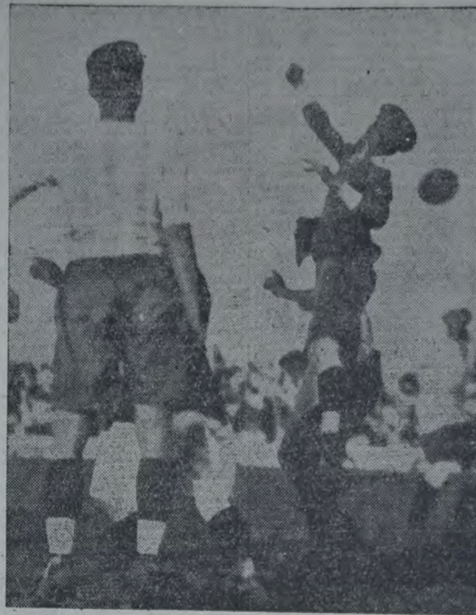
ANTE UN CORNER CONTRA RACING, ARZENI RECHAZA LA PELOTA con un puñetazo.